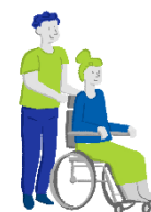
Cura e riabilitazione della persona disabile