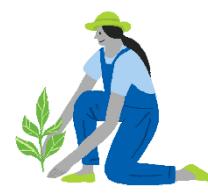
Sviluppo di attività economiche per l'autosostentamento